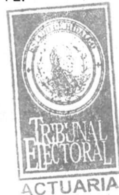
LIC. CRISTINA QUEZADA GARCÍA ACTUARÍA DEL TRIBUNAL ELECTORAL Del Estado de Hidalgo