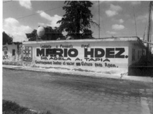
9. Comunidad Chimalpa - Tlalayote, coordenadas geográficas 19°39'56.6"N 98°30'29.7"W.