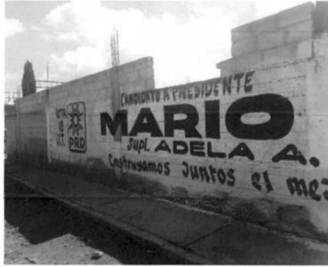
8. Comunidad Chimalpa - Tlalayote, coordenadas geográficas 19°39'56.3"N 98°30'46.3"W.