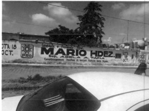
10. Comunidad Chimalpa - Tlalayote, coordenadas geográficas 19°39'56.6"N 98°30'29.7"W.