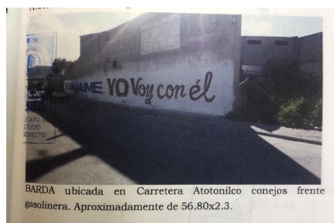
BARDA ubicada en Carretera Atotonilco conejos frente a gasolinera. Aproximadamente de 56.80x2.3.