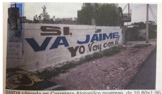
BARDA ubicada en Carretera Atotonilco progreso, de 10.80x1.96.