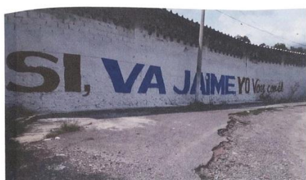
BARDA ubicada en Carretera Atotonilco refugio puente Río Salado, Atotonilco de Tula, Hgo. 25x2.30.

156. Dichas imágenes se plasman a continuación: