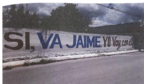
BARDA ubicada en Calle Benito López esquina Libramiento, Atotonilco de Tula, Hgo. 17.60x2.18.