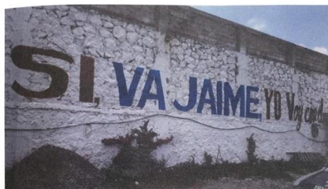
BARDA ubicada en Vito el Refugio puente río Salado, Atotonilco de Tula, Hgo. Aproximadamente 20x4