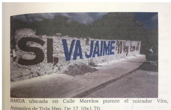
BARDA ubicada en Calle Morelos puente el mirador Vito, Atotonilco de Tula, Hgo. De 17.10x1.70.