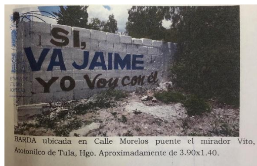
BARDA ubicada en Calle Morelos puente el mirador Vito, Atotonilco de Tula, Hgo. Aproximadamente de 3.90x1.40.